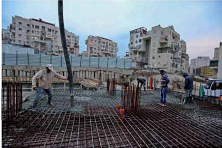
הממשלה לא תתחשב במחלוקת הנוקבת עם התעשיינים המקומיים. אתר בנייה (אילוסטרציה)

מה חושבים עורכי המחקר על היוזמה להבאת פועלים סיניים לישראל? לדברי פרופ' בנטור, אסור לשכוח שמדובר בפתרון זמני. "צריך לבחון את הדברים בשני טווחי זמן. בממשלה מתמקדים מאוד, ובצדק מבחינתם, בבנייה מהירה באמצעות יבוא עובדים וחברות. זה פתרון קל, שעונה על הלחץ הפוליטי והציבורי. אנחנו לא אומרים לא לזה. אנחנו מדברים על ניסיון לקחת אלף דירות מתוך 60-70 אלף דירות שרוצים לבנות, ולבנות