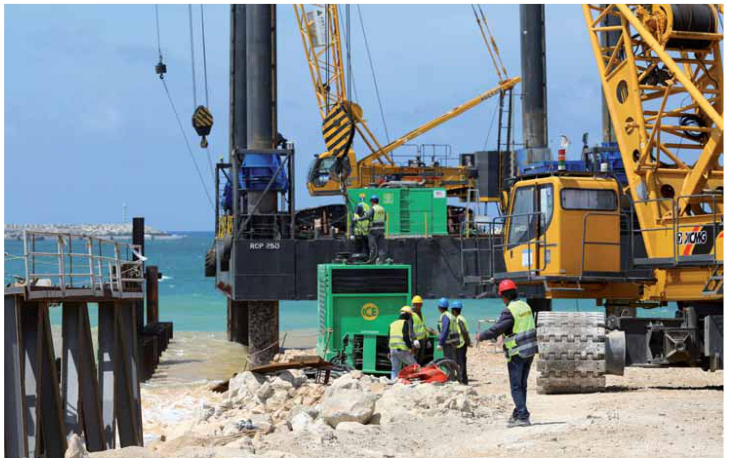
הרחבת נמל אשדוד

כיום המצב השתנה, אומר שי. הסינים מהללים את דרך המשי ורואים בה דרך כפולה — מעין חגורה יבשתית ונתיב ימי. היא אף הוכרזה כסמל תקווה לקידום המטרות שהציבה לעצמה בייג'ין בשעות לא קלות לכלכלתה ולכלכלת העולם. הרעיון פשוט לכאורה: חיזוק הקשר היבשתי בין סין למרכז אסיה, למזרח התיכון ולאירופה ומתן תנופה למדינות דרום ודרום-מזרח אסיה — ודרכן, בנתיב הימי, גם לאפריקה המזרחית. בכל מקרה, פיתוח הנתיבים החוצה ומהעולם החיצון לסין אמור להאיץ פיתוח פנים-סיני, בעיקר במערב ובדרום-מערב המדינה, שזקוקים לתשומת לב מיוחדת.