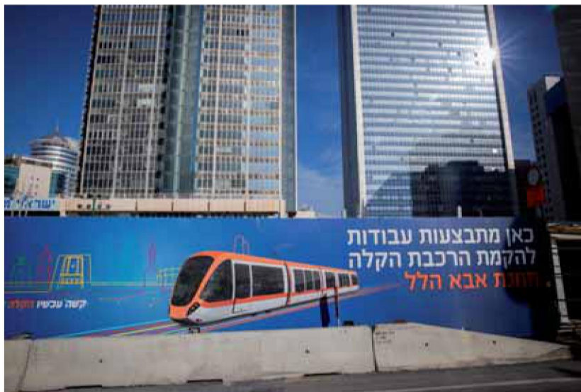
מעורבות פעילה של סין. העבודות על הקמת הרכבת הקלה בתל אביב