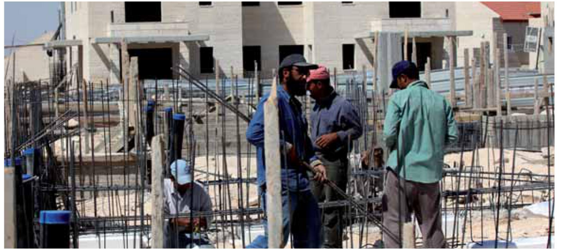
היבטים הבטחוניים מגבילים את היקף הגידול הפוטנציאלי. פועלי בניין פלסטינים

ב-2015 בלבה, השקיעה סין קרוב ל-5.7 מיליארד דולרים בתשתיות במזרח התיכון ובצפון אפריקה, וב-2016 זינק היקף ההשקעות בתשתיות ל-21.5 מיליארד דולרים. גם בישראל מעורבת סין בהקמת תשתיות, דוגמת כריית מנהרות הכרמל בחיפה, הקמת הרכבת הקלה בתל אביב והרחבת נמלי אשדוד וחיפה, לצד הכניסה שלה לתחום הבניה למגורים. לצד השקעות אלו, מציינים חוקרי המכון, עניינה המוצהר העיקרי של סין בישראל הוא בתחום החדשנות. בעיני סין ישראל בולטת על-אף קוטנה בהישגיה המדעיים, במספר חברות ההזנק שלה ובמספר חתני פרס נובל שלה. לאור הצורך החיוני של סין בטכנולוגיות מתקדמות ובפתרונות חדשניים עבור אוכלוסייתה הגדולה והמתבגרת, משקיעה סין בישראל בתחומי היי-טק, חק לאות ומזון, טכנולוגיות מים, מד-טק וביו-טק. על-פי הערכות משרד הכלכלה, ב-2015 היה היקף השקיעותיה הכולל למעלה מחצי מיליארד דולרים. סין מעודדת גם הקמת מיזמי חדשנות ישראלית בסין, דוגמת עיר המים בשואר-גואנג, בשילוב טכנולוגיות מים ישראליות. הקמת מכון אקדמי טכנולוגי בגואנג-דונג על-ידי הטכניון, שמומנה בתרומת 130 מיליון דולר מהמיליארדר לי קא-שינג היא דוגמה לתפקידם של אנשי עסקים מסין בקידום היחסים בין המדינות. בשנים האחרונות נרשמת בישראל תנועה ערה של משלחות אנשי עסקים סיניים, לצורך השקעה בחדשנות, בתחומים שהגדירה